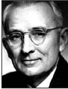
DALE CARNEGIE (1888 - 1955)